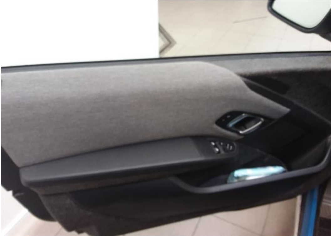
Dveře řidiče vnitřní část