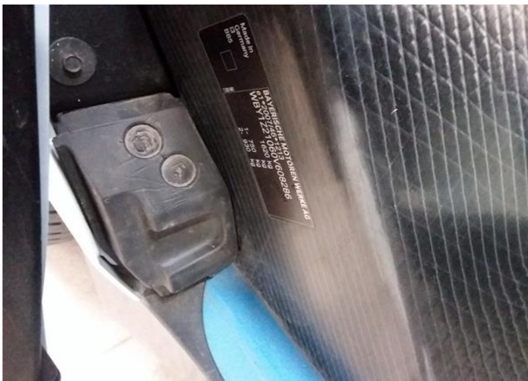
Foto VIN 2