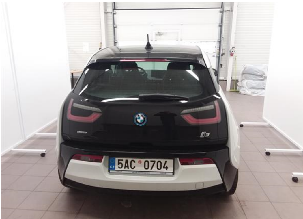
Zadní část vozu