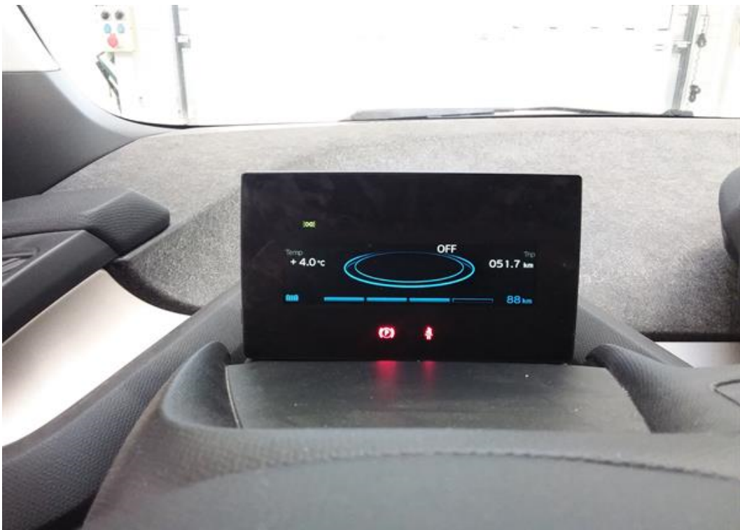
Palubní deska od řidiče