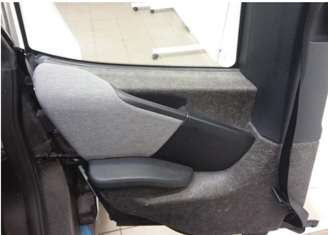
Zadní levé dveře vnitřní část