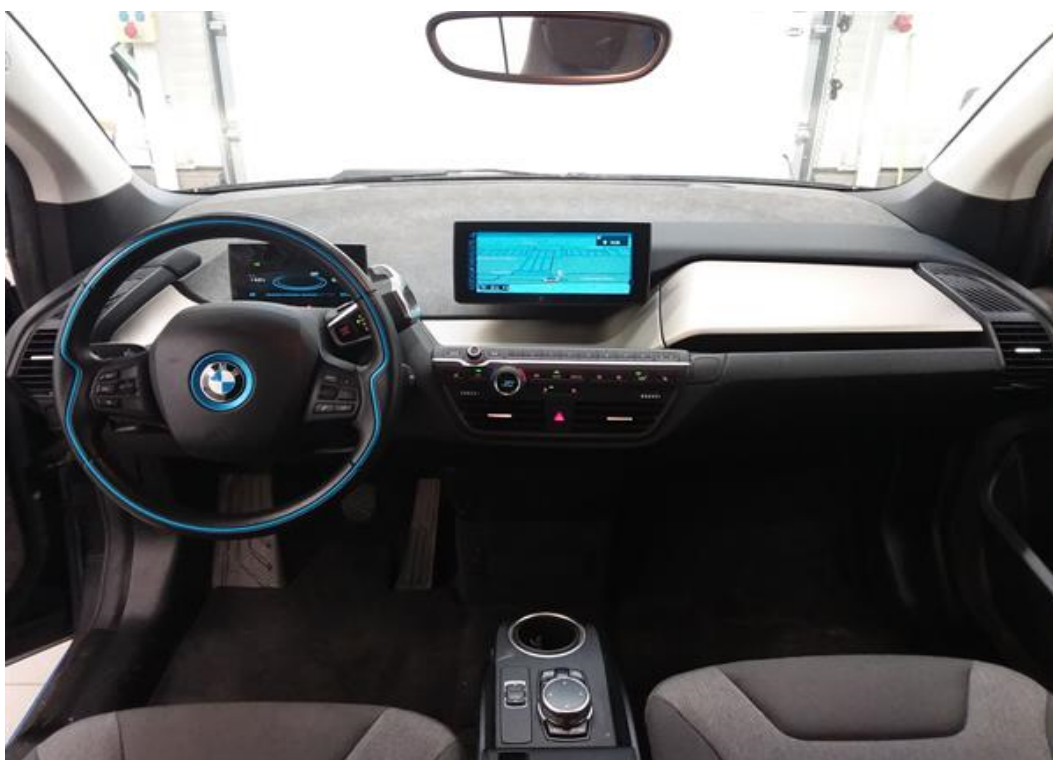
Palubní deska celá