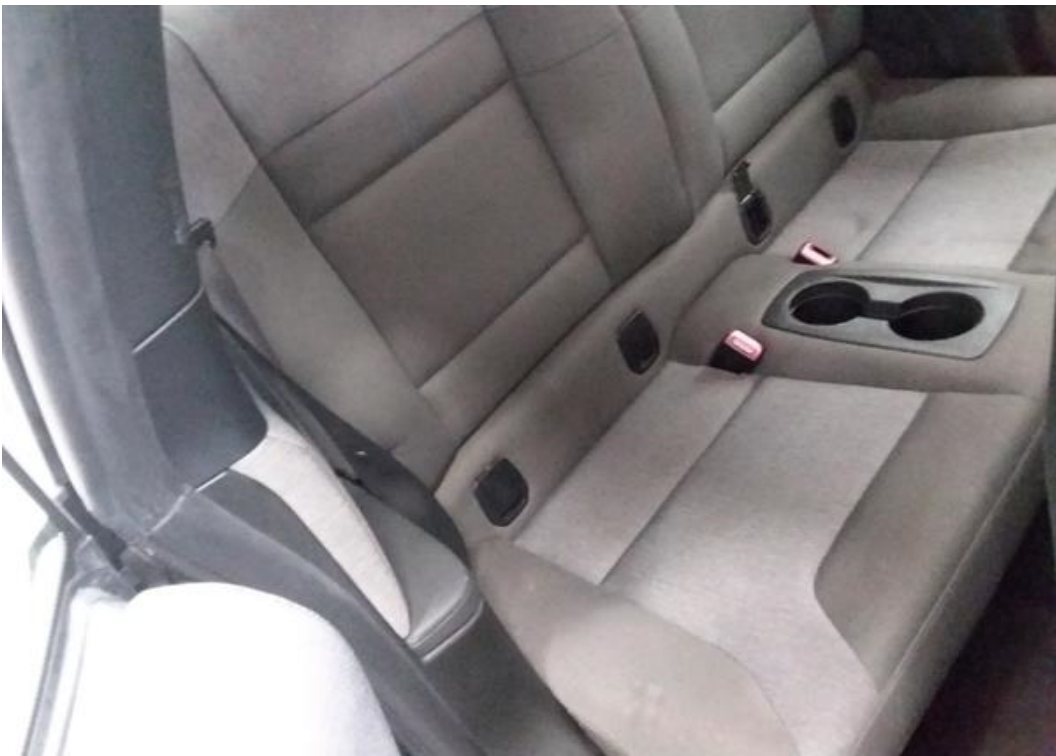
Zadní pravé sedadlo