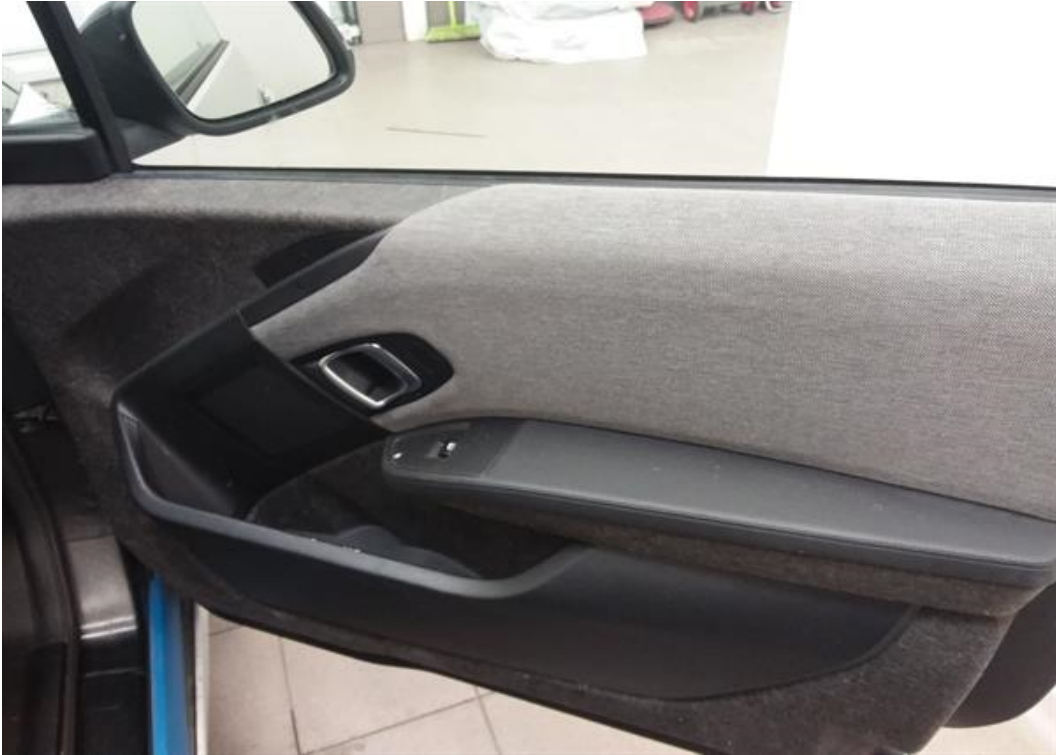
Dveře spolujezdce vnitřní část