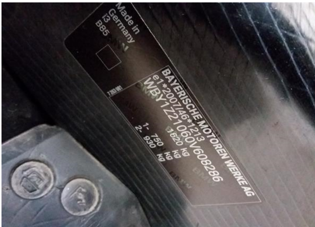
Foto VIN 1