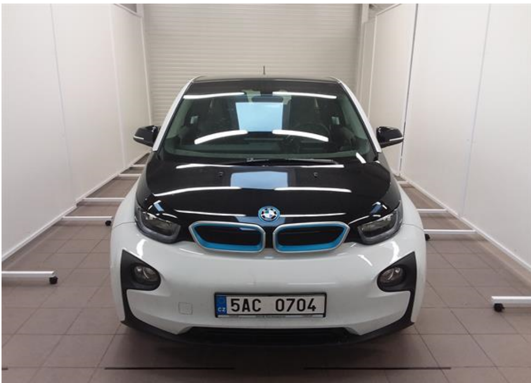
Přední část vozu