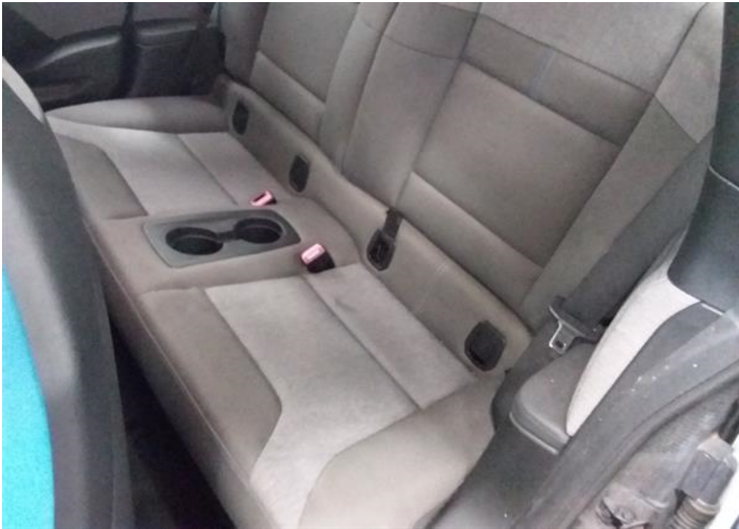
Zadní levé sedadlo