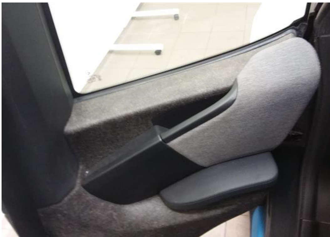
Zadní pravé dveře vnitřní část